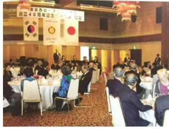
いよいよ祝宴の始まり。