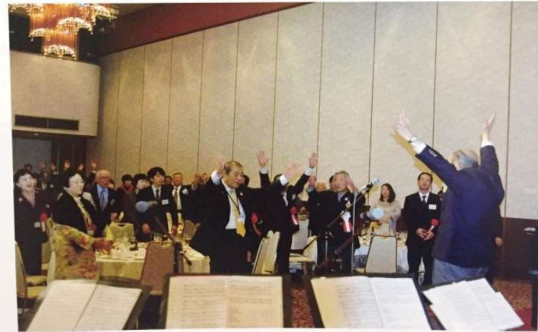
緒方先生、少し背筋が曲がって来られました。両手両腕がピンと伸び、まだまだ若い。