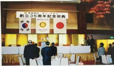
韓国と日本の国家を斉唱し、厳粛かつ相互理解に満ちた記念例会が開催された。