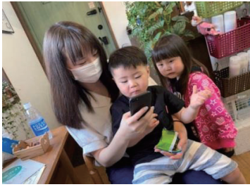
笹本会員 娘と孫達です。