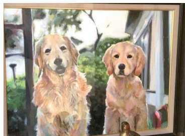
佃会長エレクト 亡き犬達の肖像画