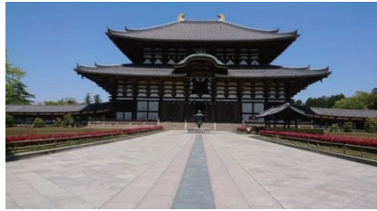
入江会員 4月の終わりのお昼の東大寺... 空は晴れ渡っていますが淋しい限りでした。