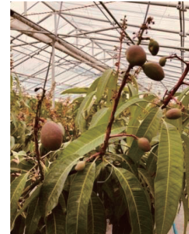
有馬P会長 マンゴーがテニスボール 位の大きさになりました。