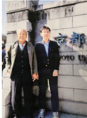
山上P会長 孫と一緒に 2020.4.4