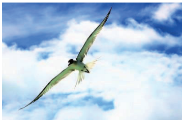
植野教会員 自信のベストショット・ タヒチボラボラ島にて