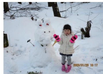
吉村P会長 自慢の孫です