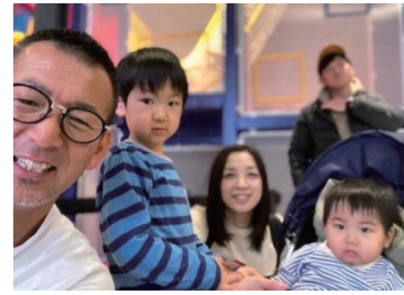
川野会員 ヤマハミュージアムにて