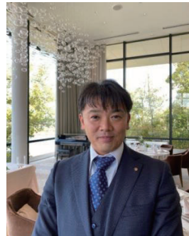
山川会員 イリスウォーターテラス あやめ池にて