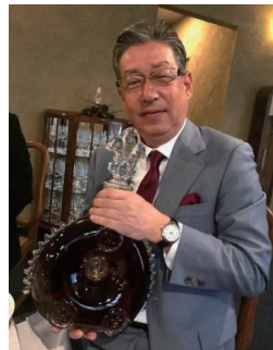
福川会員 レミーマルタン・ルイ13世 を戴いてほろ酔い気分