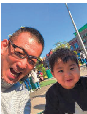
川野会員 息子とUSJにて