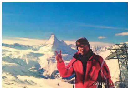
三木P会長 スイス マッタホルンにて