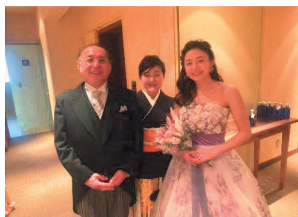
野阪会員 長女結婚式