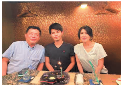
寺田会員 息子24歳です