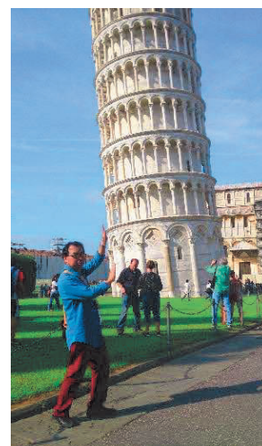
松中会員 やってみました