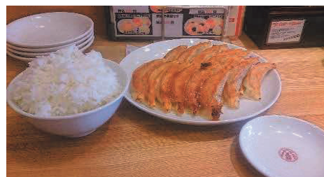
猪上会員 昔(4年前)の昼食