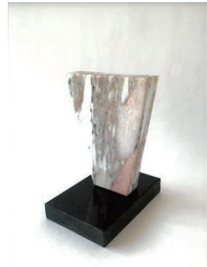
2024-25年度内輪会トロフィー

持続可能なロータリーに！ 共に学び、共に行動 Make Rotary Sustainable! Learn together Act together