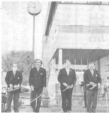
時計塔の前でテープカットを行う奈良西口一環のメンバーと仲川市長（右から2人目）＝28日、奈良市中登美ヶ丘6丁目の近鉄学研奈良登美ヶ丘駅前

テークカットに参加した仲川元庸市長は「奈良市、生駒市、木津川市など、多くの人々が利用する駅で大