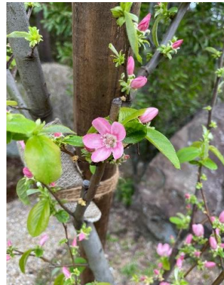
霊山寺 花梨

持続可能なロータリーに！ 共に学び、共に行動 Make Rotary Sustainable! Learn together Act together