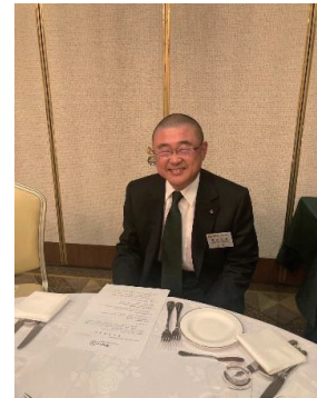
東山光秀クラブ広報理事