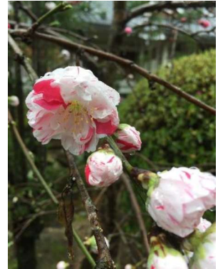
霊山寺 枝垂れ桃

持続可能なロータリーに！ 共に学び、共に行動 Make Rotary Sustainable! Learn together Act together