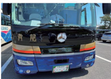
奈良交通さんの四神 こんな素敵なバスで回りました。